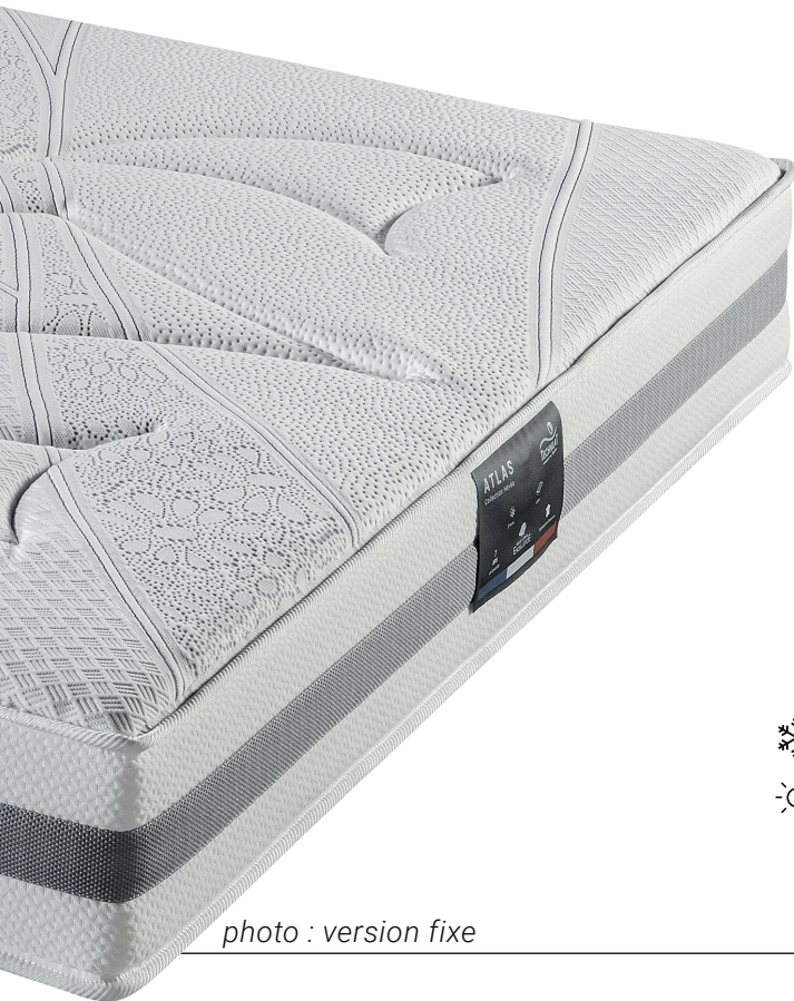
photo : version fixe