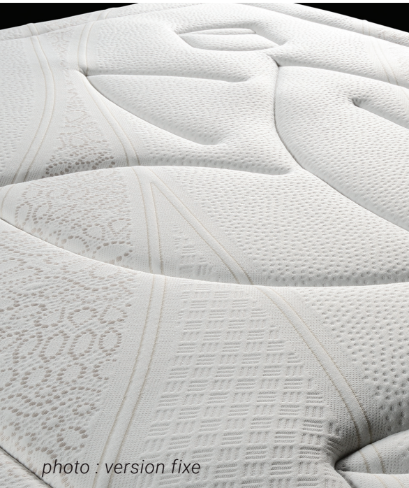
photo : version fixe